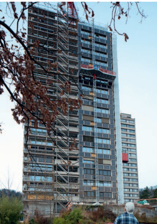
«Fassadenbänder» bestimmen das neue Erscheinungsbild.

wählte die BGZ die Sowohl-als-auch-Strategie: Das nachträgliche Dämmen kahler Betonplatten sowie der Einbau von dreifach verglasten Fenstern sind deshalb ebenso wichtiger Teil des umfassenden Erneuerungsprogramm wie der Ersatz fossiler Brennstoffe durch eine lokale und ökologische Alternative: Nach der zweiten Umbauetappe werden die Gasanschlüsse gekappt und die 170 Wohnungen inskünftig über eine grosse Pelletfeuerung mit Heizwärme und Warmwasser versorgt. Diese wird auch das benachbarte Einkaufszentrum und ein Hallenbad mit Energie beliefern. «Der Heizwärmebedarf wird um den