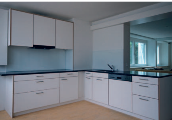
Die Wohnungen verfügen neu über grosszügige Wohnküchen.