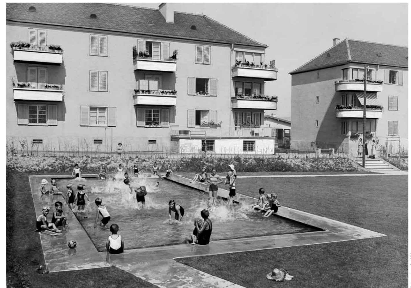
1930 erstellte die Gemeinnützige Baugenossenschaft Limmattal (GBL) in Zürich Albisrieden ihre erste Siedlung.

Die ersten Wohnbaugenossenschaften entstanden in der Schweiz bereits zwischen 1860 und 1870. Noch vor der Jahrhundertwende mussten viele dieser frühen Genossenschaften wegen einer Wirtschaftskrise ihren Bestand jedoch wieder auflösen beziehungsweise verkaufen. Bis zum ersten Weltkrieg waren es dann vor allem die Eisenbahnergenossenschaften, die der Bewegung neuen Schub verliehen, denn die Bahnarbeiter waren dringend auf Wohnraum in der Nähe ihrer Arbeitsplätze angewiesen. Eine zweite Gründungswelle von Baugenossenschaften fand während und nach dem Zweiten Weltkrieg statt. Die Ent-