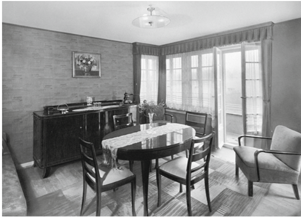
Die Baugenossenschaften wollten auch den Arbeiterfamilien angemessenen Komfort bieten.

erzählt vom Altersbetreuungsdienst der FGZ, den er erst kürzlich in Anspruch nahm: Eine Begleitperson fuhr mit ihm für eine Zahnbehandlung ins Uniquartier.