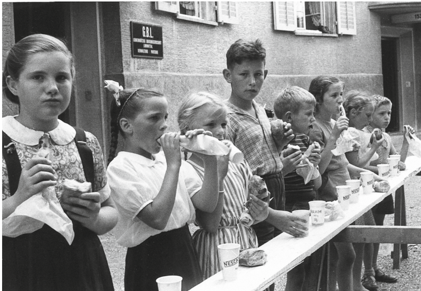
Da war eine Bratwurst noch ein Festmahl und der Genossenschaftsgeist spürbar: 25-Jahr-Jubiläum der GBL (1954)