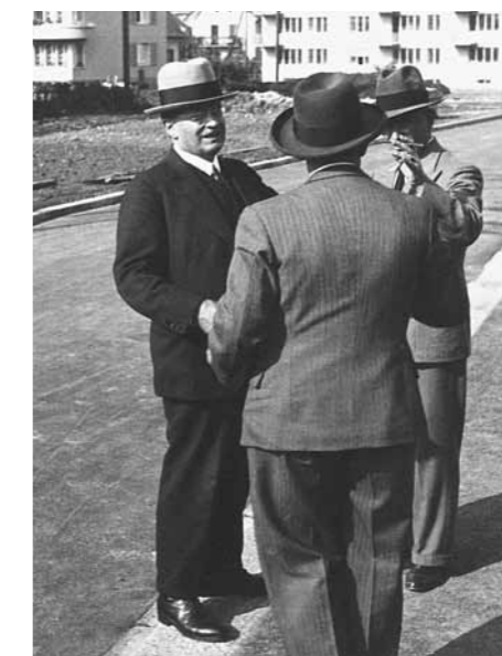
Die Genossenschaftspioniere waren mutige Visionäre. Im Bild der Vorstand der GBL im Jahr 1934.

stand des Dachverbandes engagierte er sich. Als Ehrenpräsident des Zürcher Regionalverbandes ist er bis heute mit der Genossenschaftsszene verbunden.