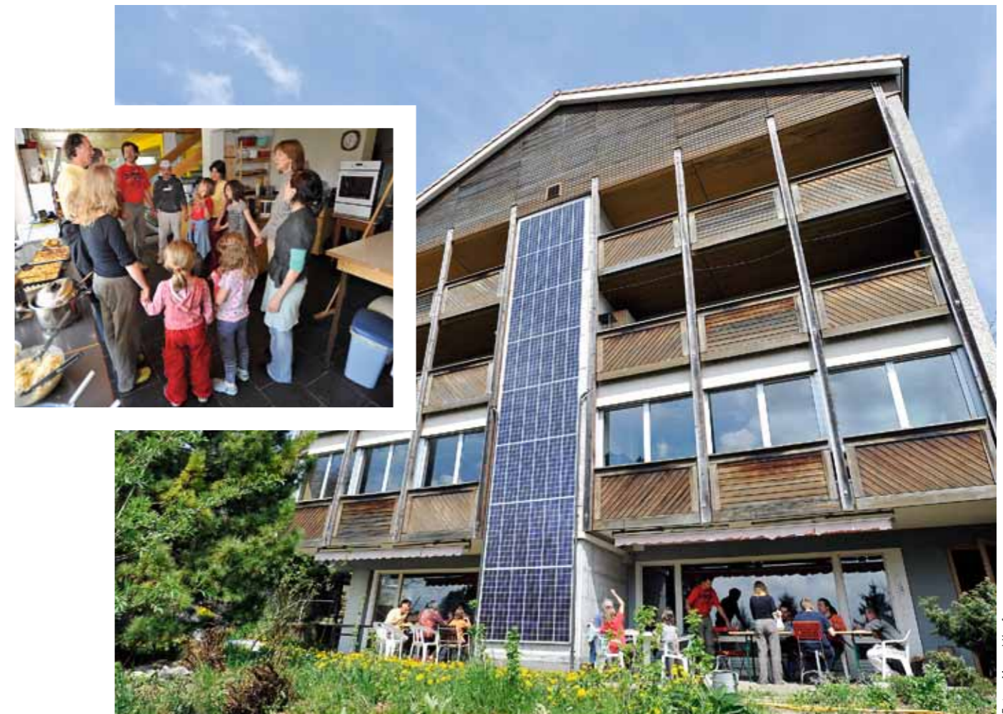
Erweckt ein altes Kurhaus zu neuem Leben: Gemeinschaft Ökodorf Sennrüti.

Eine Kommune, betont René, war aber nie die Idee. «Wir wussten ja aus eigener Erfahrung, dass es wichtig ist, sich auch zurückziehen zu können.» In einem ausführlichen Fragebogen ermittelten sie die Bedürfnisse jedes einzelnen. Ihre Vision hielten sie schriftlich fest: «Wir leben, wohnen und arbeiten in einer ganzheitlichen Lebensgemeinschaft mit einer nachhaltigen Sozialstruktur, verbunden durch gemeinsame ökologische, soziale, kulturelle und wirtschaftliche Werte. Wir pflegen eine weltoffene, gastfreundliche und friedliche Gemeinschaftskultur, welche die Unterschiedlichkeit des Einzelnen wertschätzt und zu Selbstverantwortung und persönlicher