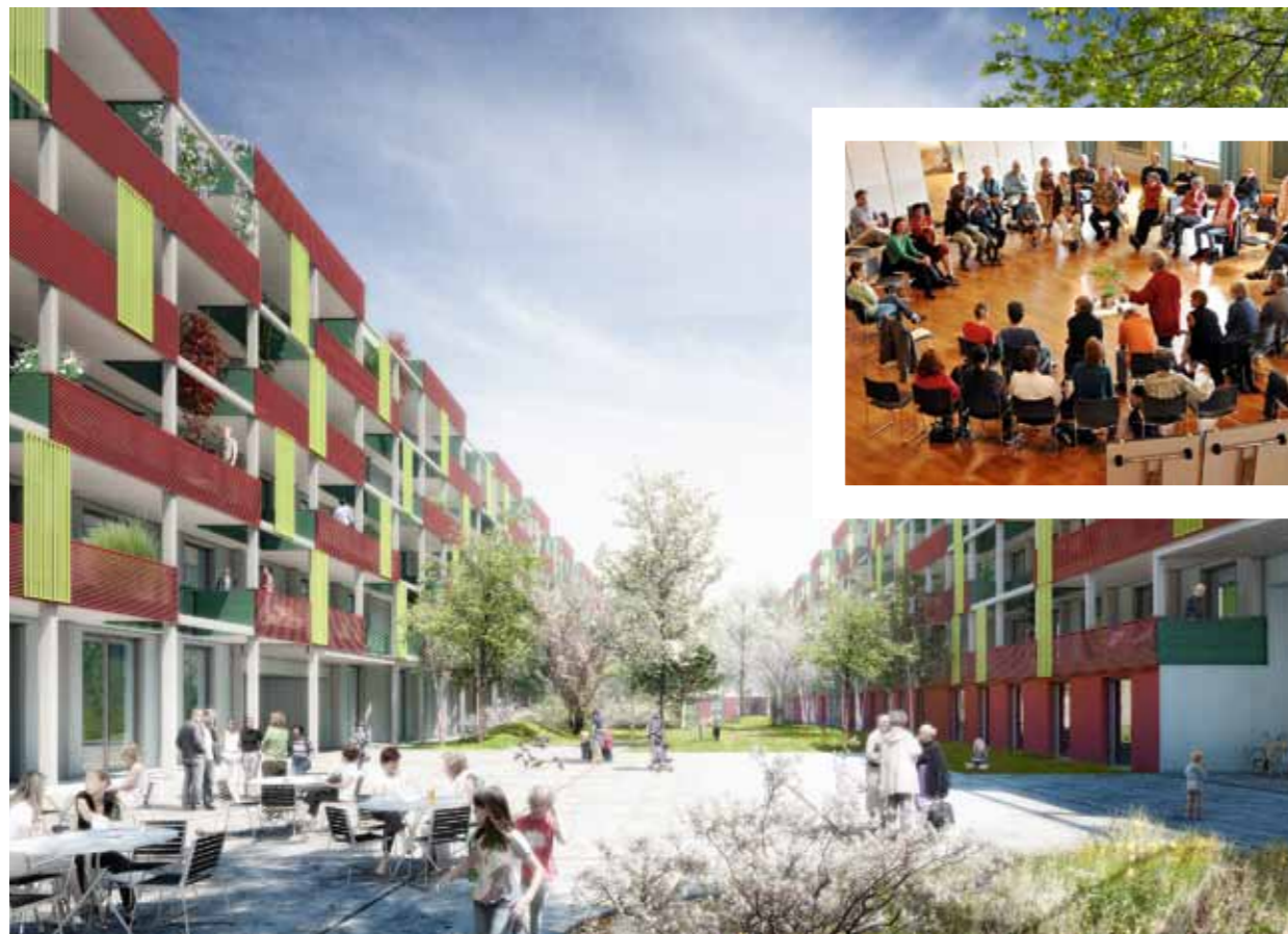
Will Jung und Alt zusammenbringen: Mehrgenerationenhaus der Gesewo in Winterthur.

Noch diesen Frühling möchte die Gesewo mit dem Bau beginnen. In verschiedenen Arbeitsgruppen und Workshops sind die Mitglieder des Vereins «Giesserei» eifrig daran, das Leben im Mehrgenerationenhaus zu planen. Doch wie will die Genossenschaft sicherstellen, dass die utopisch anmutenden Ideen sich tatsächlich so umsetzen lassen?